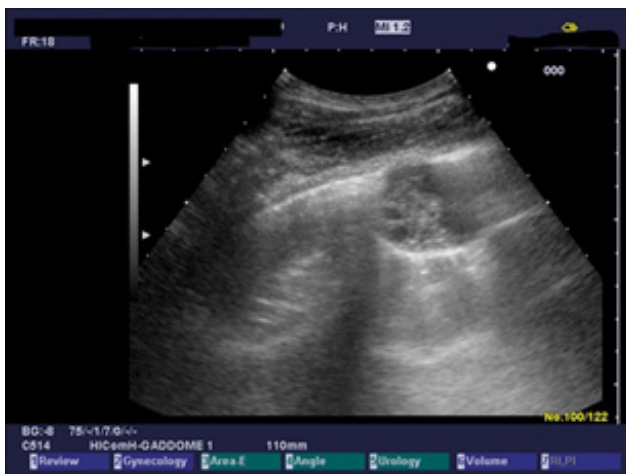
Figura 5. Quiste equinocístico pulmonar con pequeños quistes hijos (tipo CE3b en la clasificación de la OMS).