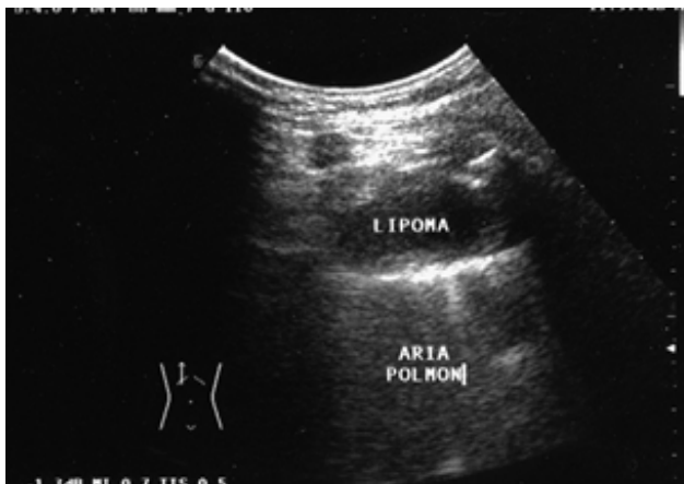
Figura 4. El lipoma pulmonar aparece en la ecografía como un nódulo hipoanecoico localizado.