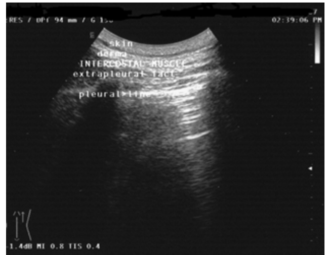
Figura 1. Estructuras que pueden explorarse mediante una ecografía torácica.

Las estructuras torácicas que pueden ser exploradas por ecografía incluyen; la superficie, 1-piel, 2-dermis, 3-músculos intercostales y membrana endo torácica, 4-grasa extra pleural y las pleuras parietal y visceral tal se observa en la (Figura 1). Una vez que el haz de ecografía ha penetrado en la pleura visceral, el aire de los pulmones lo dispersa por completo. “La impedancia acústica elevada generada en la interfaz entre los tejidos blandos superficiales y el aire en el pulmón da como resultado una línea ecogénica delgada (<3 mm) conocida como línea pleural” (Targhetta, Bourgeois, Chavagneux, & Balmes, 2002).