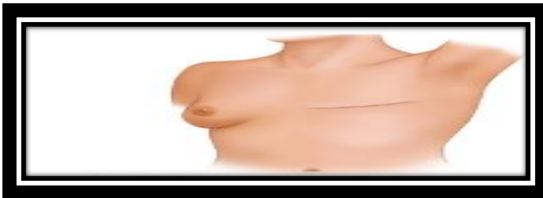
Figura N° 2 Mastectomía