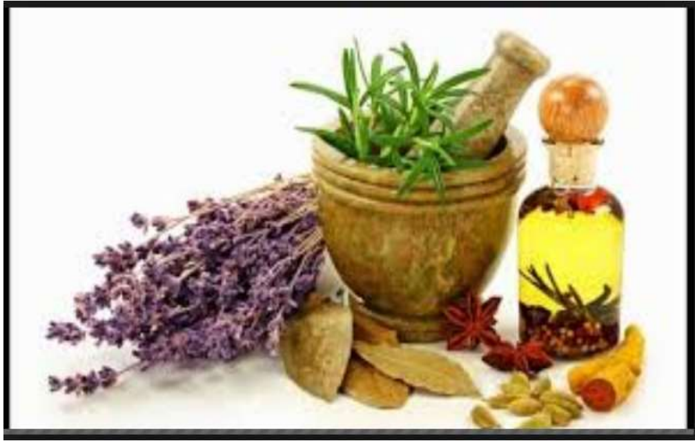
Imagen N°1. Medicina Natural o Bioenergética