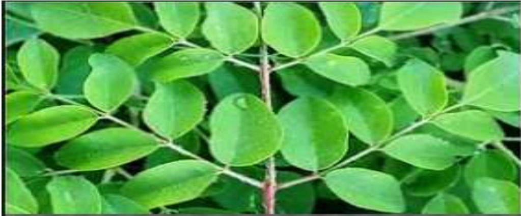
Imagen N° 3. Planta de Moringa Olifeira