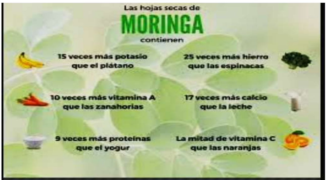
Imagen N° 4. Propiedades de la Hoja de la Moringa Olifera

conózcase entre ellas; las vainas verdes (parecidas a las legumbres), las hojas, las flores, las semillas (negruzcas y redondeadas) y las raíces son muy nutritivas y se pueden usar para el consumo humano por su alto contenido en proteínas, vitaminas y minerales.